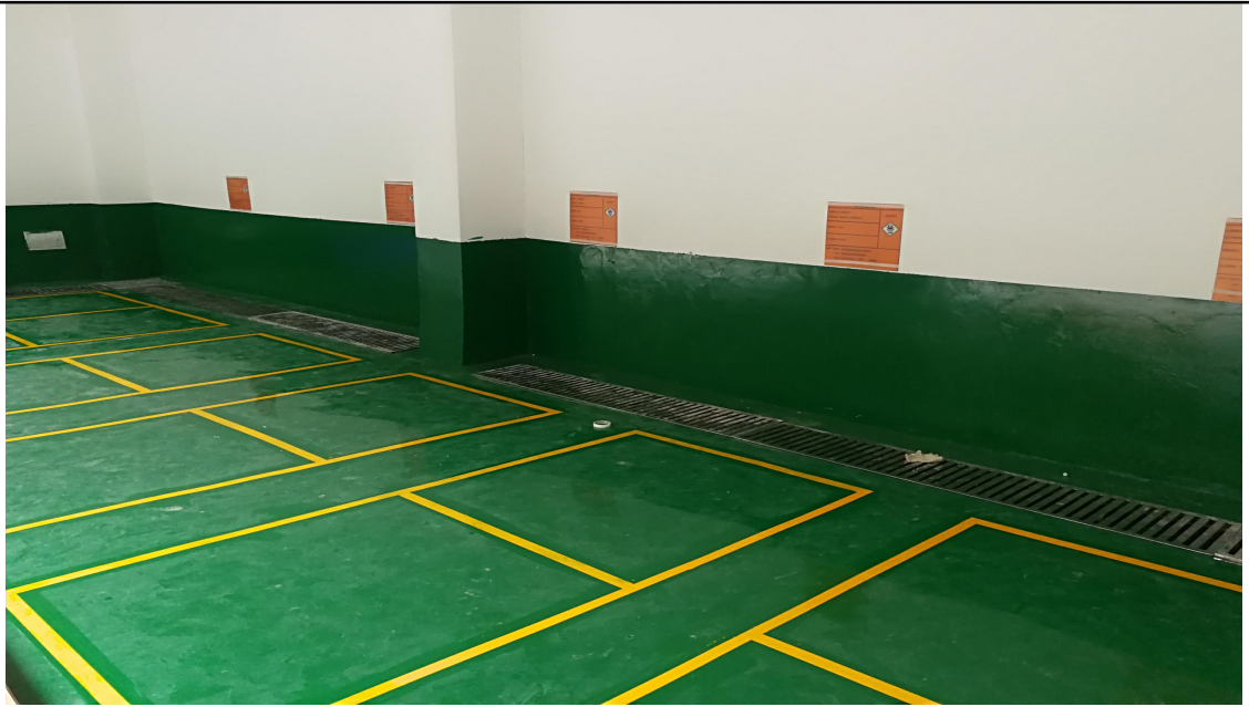
图 4 危废间防腐防渗情况图