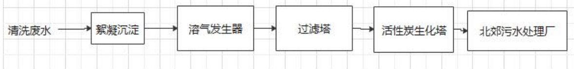
图 5 厂区内工业废水处理机工艺流程图

本项目生产废水外排量为 0.172m 3 /d（51.6m 3 /a），经区内工业废水处理机处理后排入北郊污水处理厂。生产废水主要是机加工部件清洗废水。自建工业废水处理机工艺流程如下：