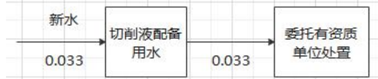
图1 切削液调配用水水平衡图 单位 m 3 /d