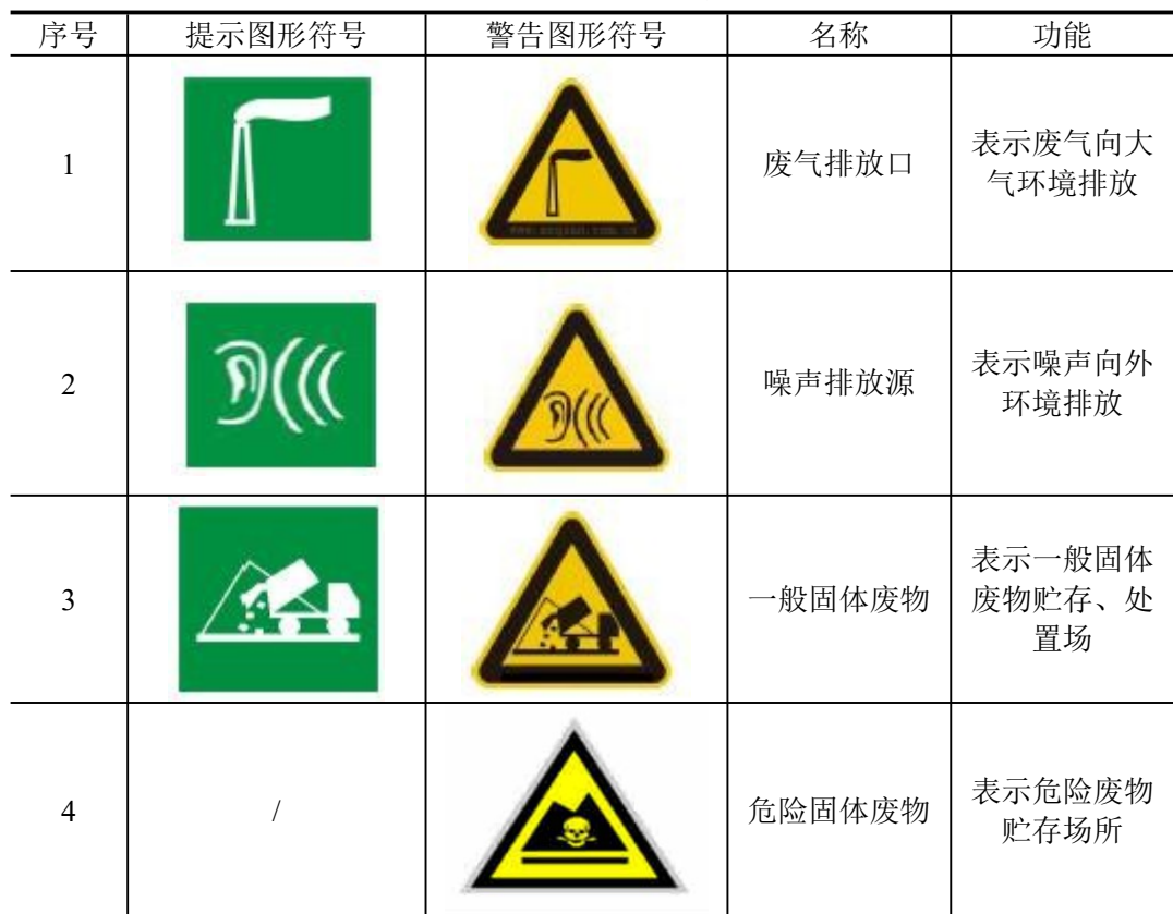
表 5-2 固废标识规范化表