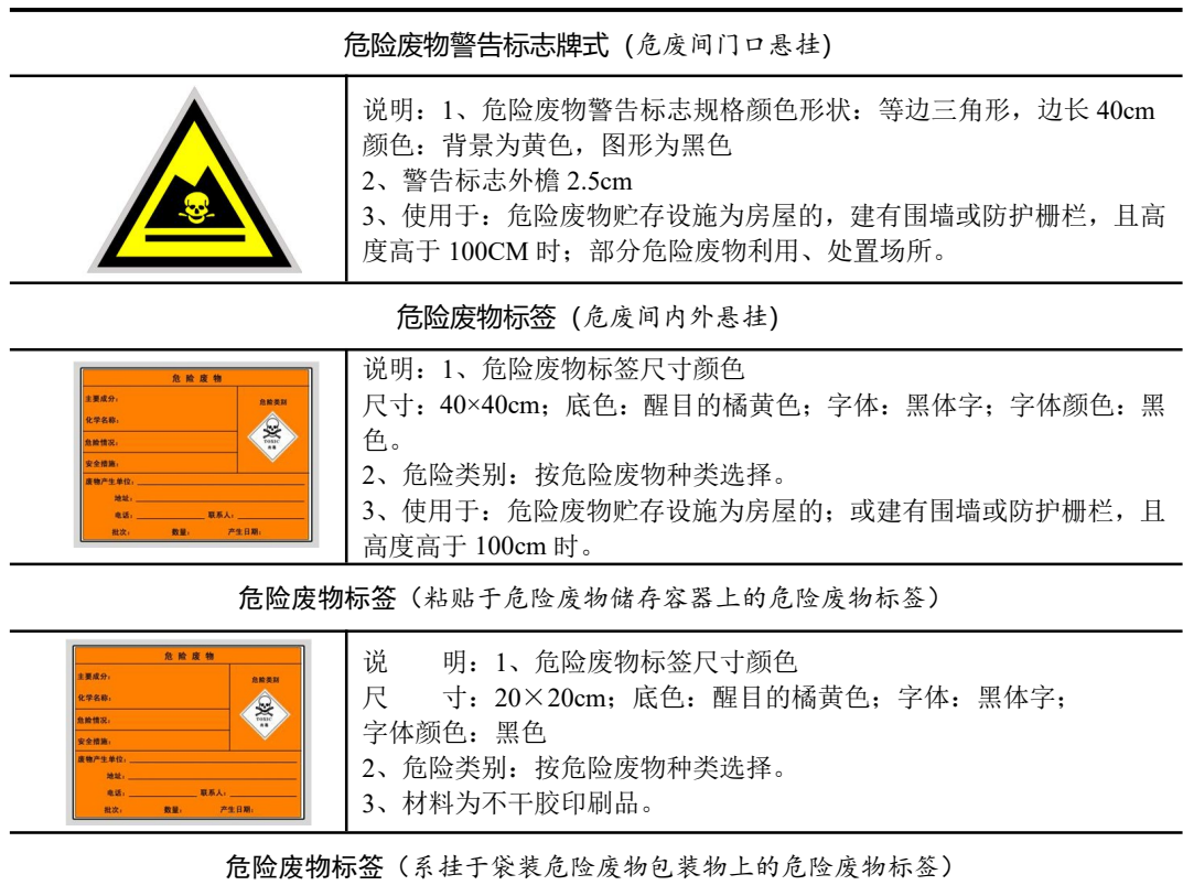
表 5-1 固废标识规范化表

使用国家环保局统一印制的《中华人民共和国规范化排污口标志登记证》，并按要求填写有关内容，项目建成后，应将主要污染物种类、数量、浓度、排放去向、立标情况及设施运行情况记录于档案。